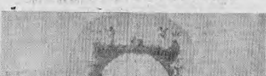
La primera procesión eucarística que se celebró en Tibas el domingo anterior, revistió un lucimiento digno de todo elogio, que de siempre trae gran concurrencia, ya que siempre presenta una dura batalla.