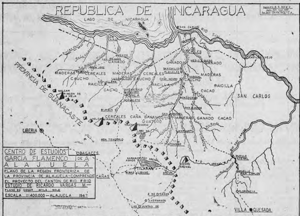
Interesante mapa que muestra la vasta y fértilísima región fronteriza norte que se desea convertir en nuevo Cantón de la Provincia de Alajuela.