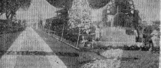
La primera procesión eucarística que se celebró en Tibas el domingo anterior, revistió un lucimiento digno de todo elogio, que de siempre trae gran concurrencia, ya que siempre presenta una dura batalla.